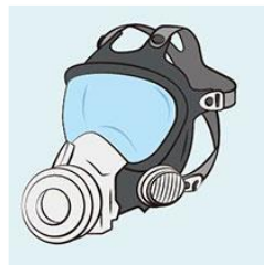
取替え式全面形面体