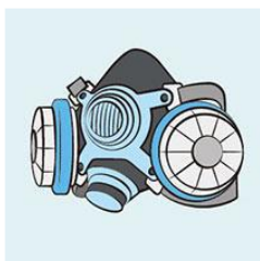
取替え式半面形面体